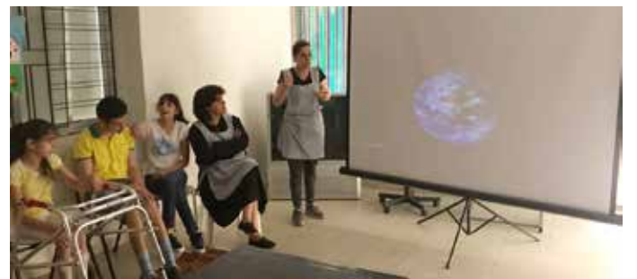
وحدة الإعاقة الجسدية

كرمال هيك، تجمّع فريق الـ PHP بالملعب الارضي، وحضرنا كلنا سوا كبار وزغار وناثقي مؤلف من عدة أجزاء، كل جزء بيحكي عن ناحية معينة بتتعلق بالبيئة : الهواء، المي، الخضار... وأكد كانت كل مرئية عم بتجاوب وتشرح الأسئلة والتساؤلات اللي طرحوا ولادنا.