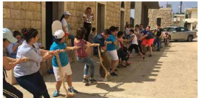
فريق عمل الدمج المدرسي - سيزوبيل جزين