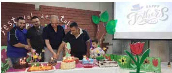
Unité des chouchous