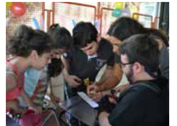
وحدة الإعاقة الجسدية