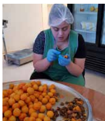
مركز المساعدة بالعمل - سيزوبيل كفرحونا