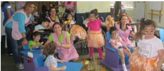
Unité de Stimulation Précoce