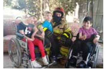
وحدة الإعاقة الجسديّة