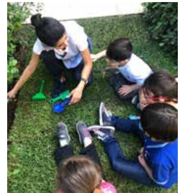
وحدة الإعاقة الفكرية