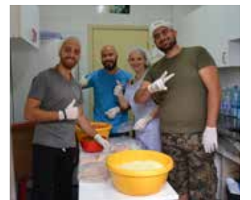
وحدة الإعاقة الجسدية